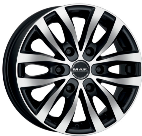
MAK Load 6 Størrelse: 16" Finish: Silver, Ice black Note: 6-huls. Specielt til varevogn og camper