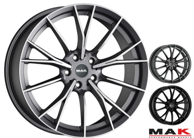
MAK Fabrik og Fabrik D Størrelse: 18" - 20" Finish: Gun-met mirror, Gloss Black, M-Titan Note: 5-huls Dedicated til BMW. Mulighed for at anvende OE kapsel Se side 22 for info vedr. D fælge