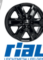
RIAL Transporter 6 Størrelse: 17" Finish: Polar Silver, Diamond Black Note: 6-huls. Specielt til varevogn og camper. 5 års overfladeganti