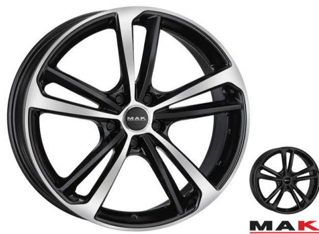
MAK Nürburg Størrelse: 19" - 21" Finish: Black mirror, Gloss black Note: 5-huls Dedicated til Audi. Mulighed for at anvende OE kapsel