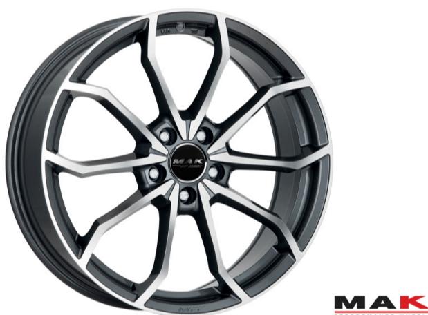
MAK Lowe-FF Størrelse: 18" - 19" Finish: Gun-met mirror Note: 5-huls. Vægtoptimeret FF teknologi Dedicated til Audi og VW. Mulighed for at anvende OE kapsel Se side 22 for info vedr. FF fælg