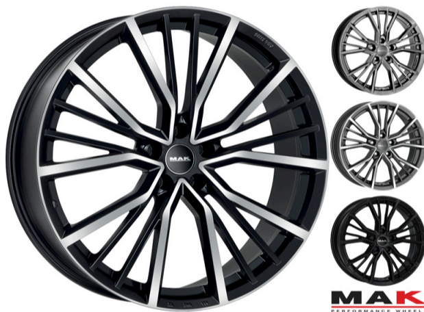
MAK Union Størrelse: 17" - 22" Finish: Black mirror, Gun-met mirror, Gloss black, Light Titan Note: 5-huls Dedicated til Audi. Mulighed for at anvende OE kapsel