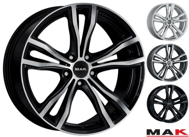
MAK X-Mode Størrelse: 19" - 21" Finish: Black mirror, Gun-met mirror, Gloss black, Silver Note: 5-huls Dedicated til BMW. Mulighed for at anvende OE kapsel