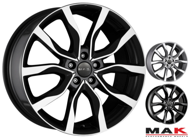
MAK Köln Størrelse: 16" - 21" Finish: Black mirror, Matt black, Silver Note: 5-huls Dedicated til Audi. Mulighed for at anvende OE kapsel