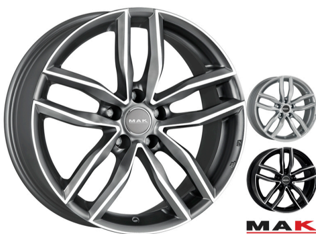
MAK Sarthe Størrelse: 17" - 19" Finish: Black mirror, Gun-met mirror, Silver Note: 5-huls Dedicated til Audi. Mulighed for at anvende OE kapsel