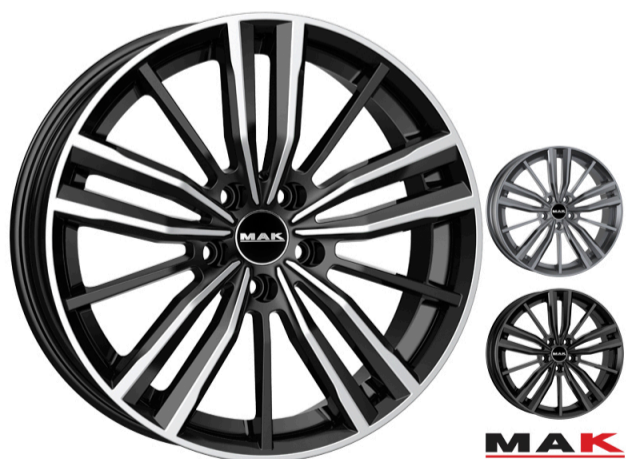
MAK Vier Størrelse: 17" - 18" Finish: Black mirror, Gloss black, M-Titan Note: 5-huls Dedicated til Audi. Mulighed for at anvende OE kapsel