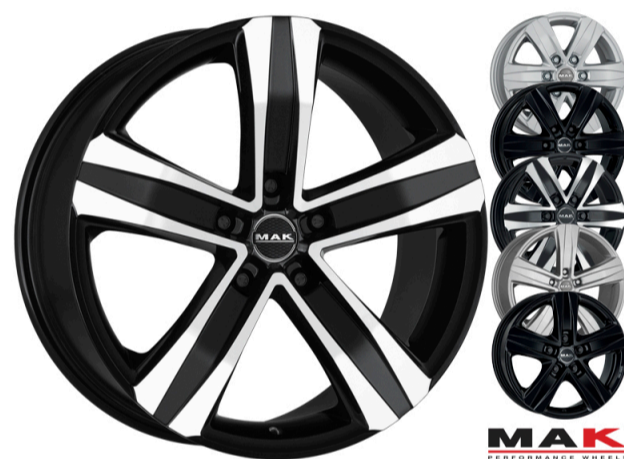
MAK Stone 5 og 6 Størrelse: 15" - 20" Finish: Black mirror, Gloss black, Silver Note: 5 og 6-huls. Specielt til varevogn og camper