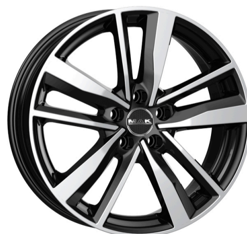
MAK Stockholm Størrelse: 16" - 20" Finish: Matt titan, Ice black Note: 5-huls. Dedicated til Volvo. Mulighed for at anvende OE kapsel