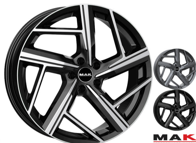
MAK Qvattro Størrelse: 19" - 21" Finish: Black mirror, Gloss black, M-titan Note: 5-huls. Dedicated til Audi. Mulighed for at anvende OE kapsel