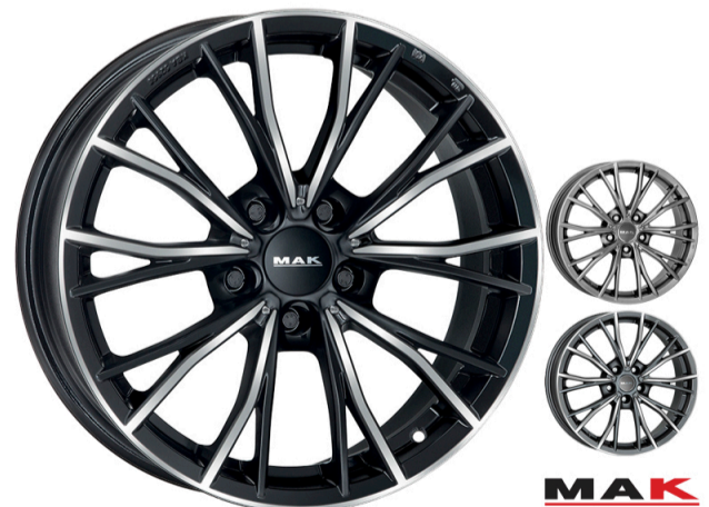
MAK Mark Størrelse: 17" - 18" Finish: Black mirror, Gun-met mirror, Light titan Note: 5-huls Dedicated til BMW. Mulighed for at anvende OE kapsel