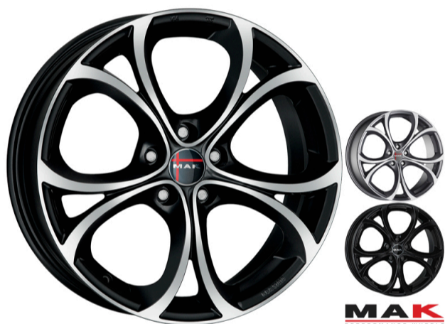
MAK Lario Størrelse: 17" - 20" Finish: Black mirror, Gun-met mirror, Gloss black Note: 5-huls. Dedicated til Alfa Romeo. Mulighed for at anvende OE kapsel