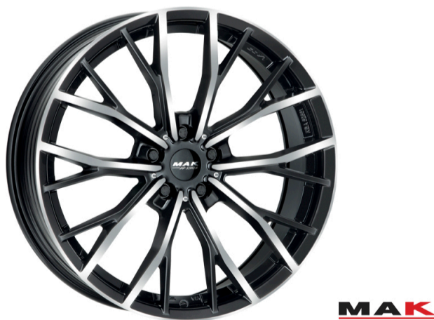
MAK Prime-FF og Prime D-FF Størrelse: 19" - 20" Finish: Black mirror Note: 5-huls Dedicated til BMW. Mulighed for at anvende OE kapsel Se side 22 for info vedr. FF og D fælge