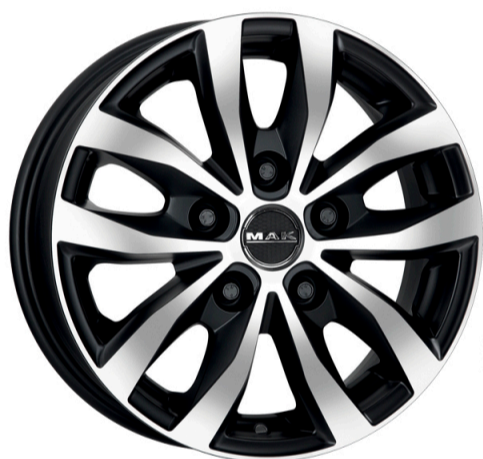
MAK Load 5 Størrelse: 15" - 17" Finish: Silver, Ice black Note: 5-huls. Specielt til varevogn og camper