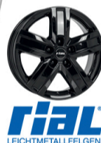
RIAL Transporter 5 Størrelse: 15" - 17" Finish: Polar Silver, Diamond Black Note: 5-huls. Specielt til varevogn og camper. 5 års overfladeganti