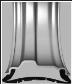
Standard-Reifen Der Reifen wird bei Luftverlust eingeklemmt und zerstört.

Im Gegensatz zu konventionellen Reifen basiert das SSR-Prinzip auf einem Reifen mit selbsttragenden, verstärkten Seitenwänden, die das Fahrzeug auch bei Druckverlust tragen. Dies verhindert im Pannenfall ein Einklemmen der Reifenseite zwischen Straße und Felge.