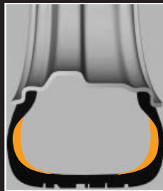
SSR-Pannenlaufreifen Die stabilen Seitenwände stützen den Reifen bei Luftverlust.